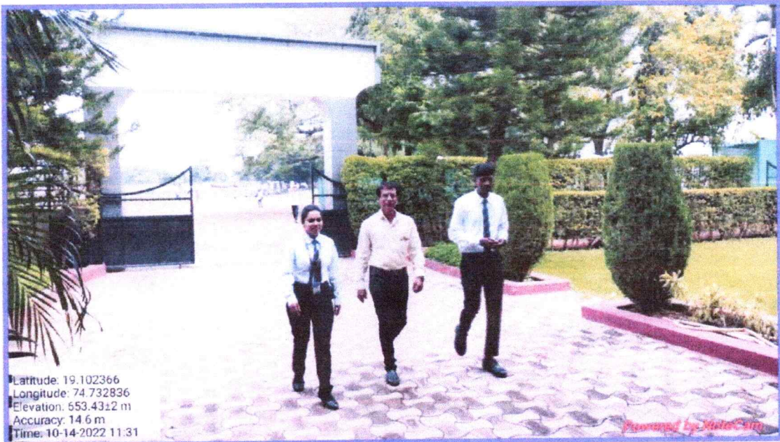
Welcoming parents towards the reception desk