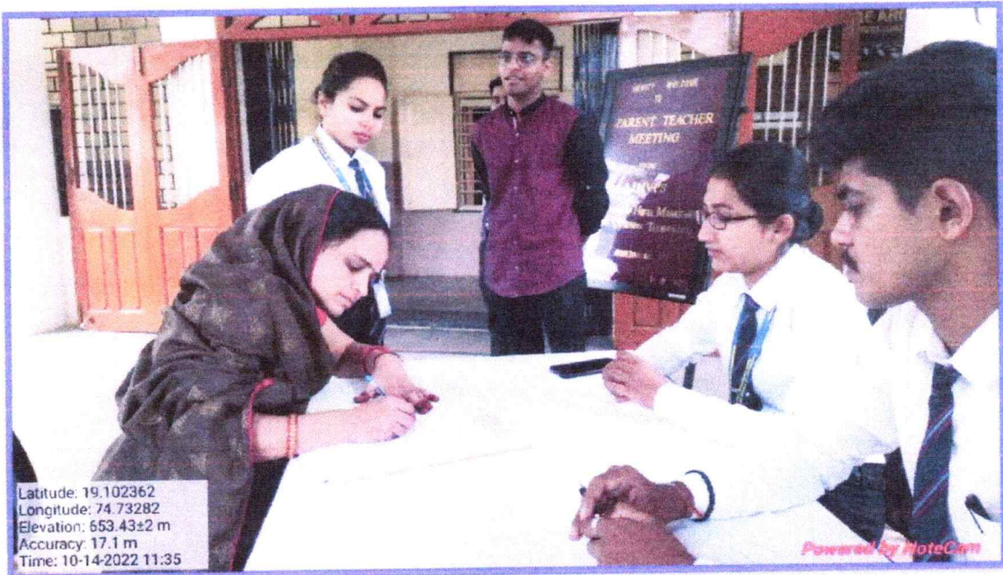
Registration of parents for the event